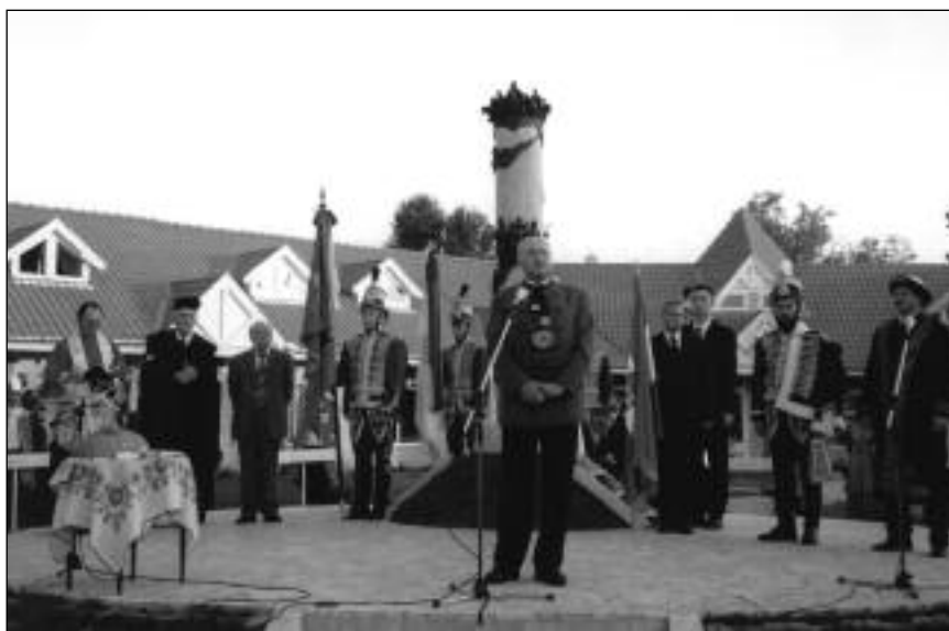
Kun emlékmű avatása a millicentenáriumi ünnepségen – Túrkeve, 2000