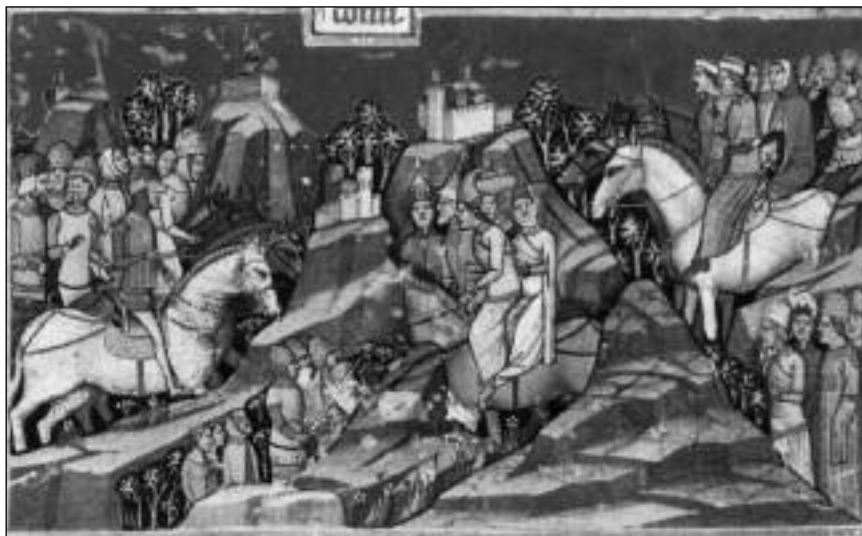
A kunok bejövetele a Kárpát-medencébe – Illusztráció a Képes Krónikából