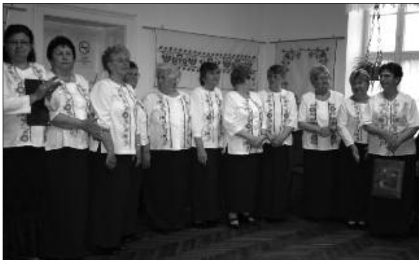
A kun hagyományok őrzői – Túrkeve, 2015