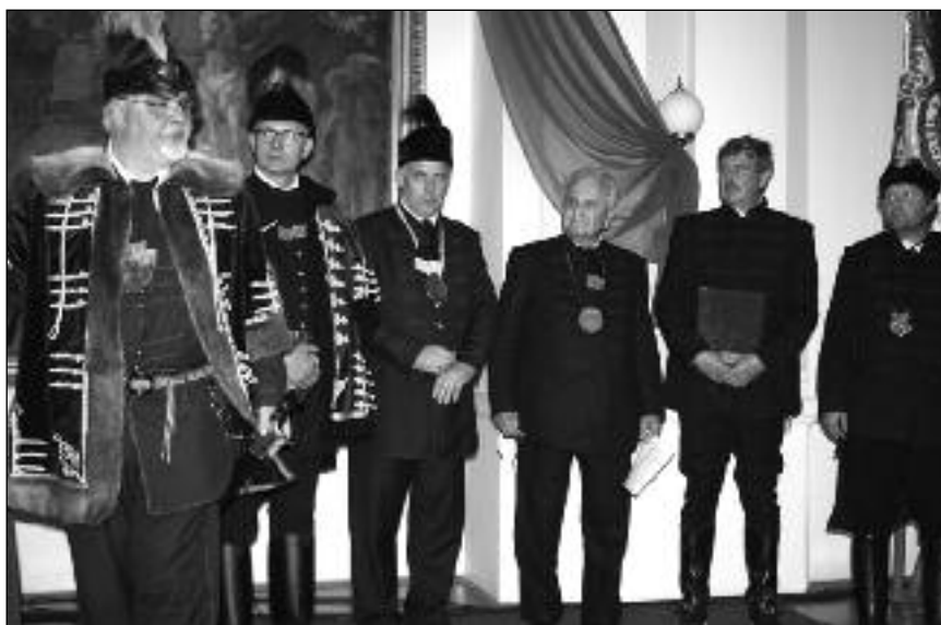
Újkori kapitányok Jászkun Napi ünnepségen – Jászberény, 2015